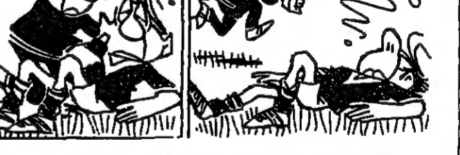
منتشيد نجوم الاس خلال مبارياتهم مع الناشئين

تقام يوم السبت للقليل على ملعب بلدية برج حمود ضمن مباريات دورة كاس الاستقلال مباراة في كرة القدم بين فريق نادي الروضة وفريق الهدى وذلك في تمام الساعة الثانية والنصف بعد الظهر.